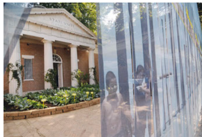
Il padiglione degli Stati Uniti ai Giardini

USLIP AVREBBE inizialmente interpellato l'artista Barbara Chase-Riboud e il fotografo William Eggleston che si sarebbero però entrambi rifiutati di rappresentare il paese nell'attuale clima politico. Il loro passo indietro è simile a quelli di molti artisti che hanno annullato rappresentazioni al Kennedy Center di Washington, il centro nazionale per lo spettacolo ribattezzato «Trump-Kennedy» dal presiden-