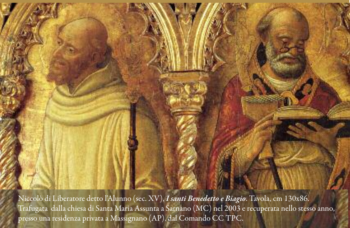
Niccolò di Liberatore detto l'Alunno (sec. XV), I santi Benedetto e Biagio . Tavola, cm 130x86. Trafugata dalla chiesa di Santa Maria Assunta a Sarnano (MC) nel 2003 e recuperata nello stesso anno, presso una residenza privata a Massignano (AP), dal Comando CC TPC.