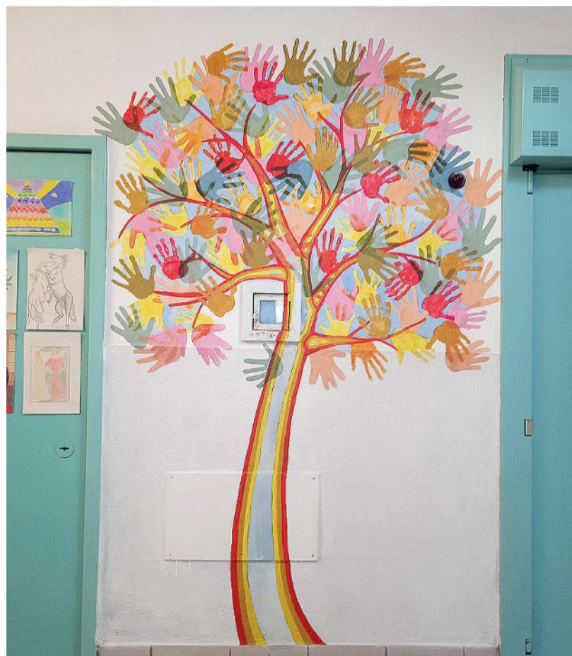
Un disegno alla parete di un corridoio al settimo reparto del carcere di Bollate